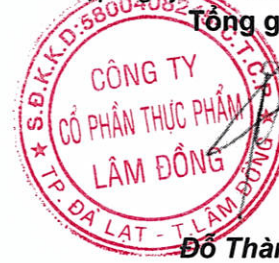
Đỗ Thành Trung