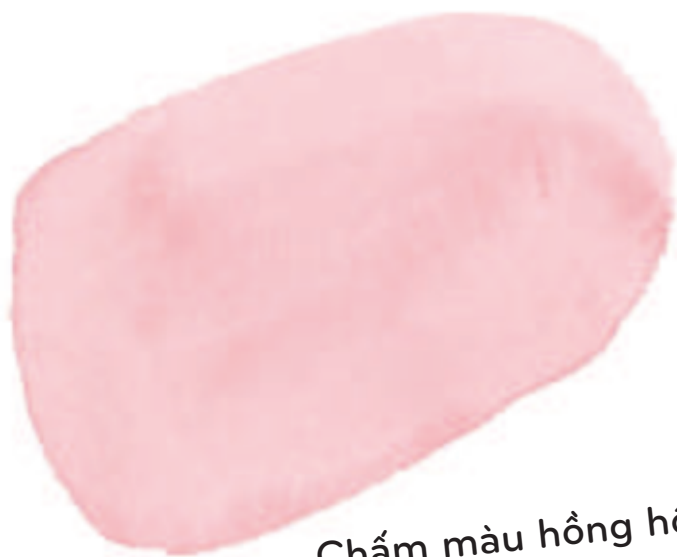
Chấm màu hồng hồng...