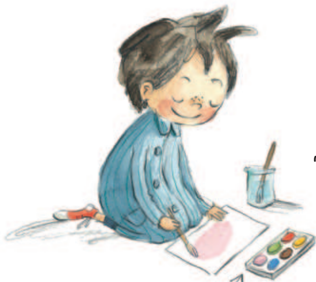
Màu nước hồng hồng

Bạn nghĩ mình có thể làm gì với các chấm màu hay vệt màu loang lổ đây? Tẩy, xoá hoặc bỏ đi ư? Khoan khoan, trò chơi thú vị mới chỉ bắt đầu thôi! Xem tờ vẽ trước một chấm màu này. Ô, bạn thử tưởng tượng xem có thể “hô biến” chấm màu này thành gì nào? Hãy vẽ ra nhé!